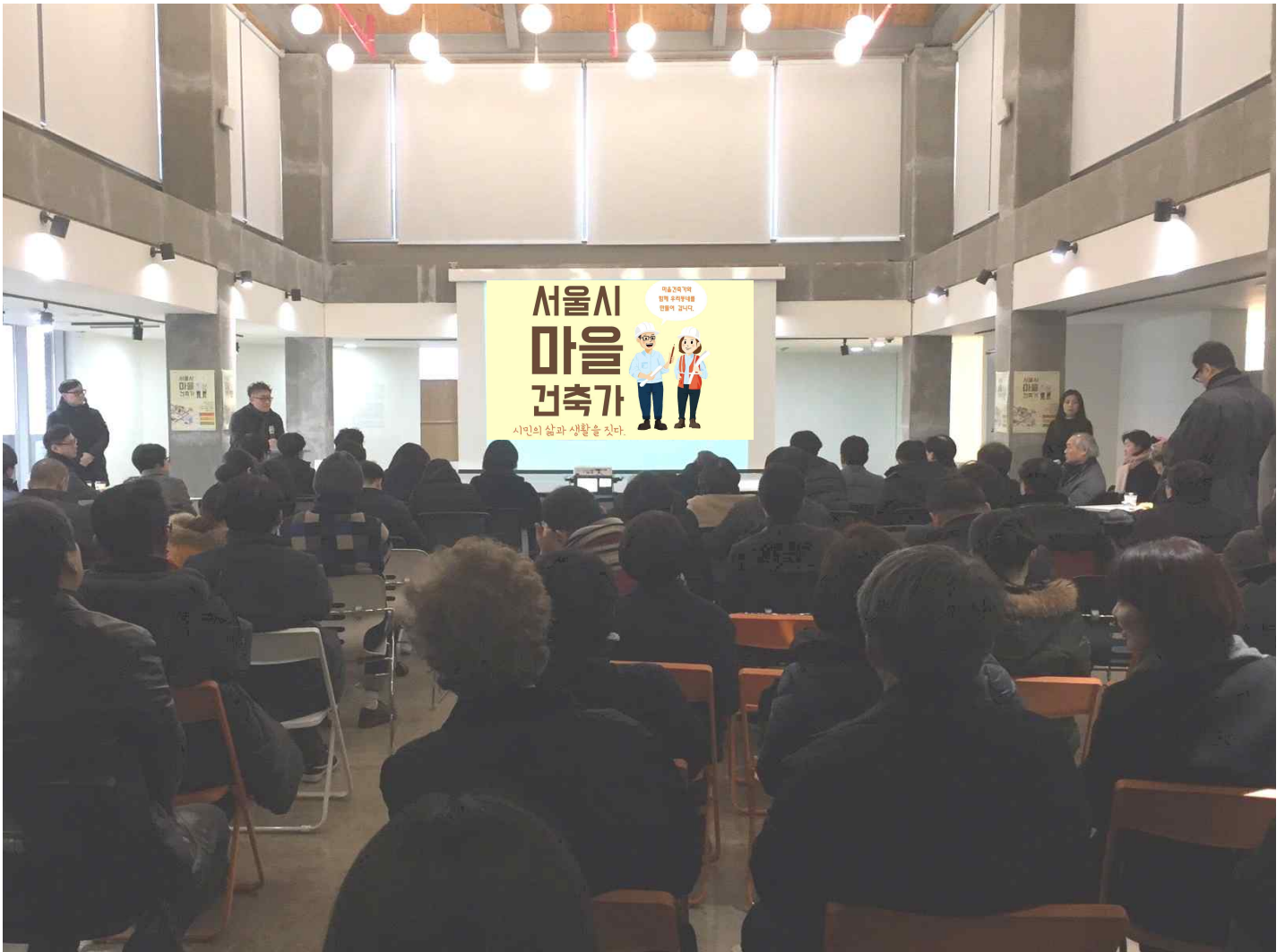
서울도시건축센터에서 '마을건축가' 제도 설명회 개최